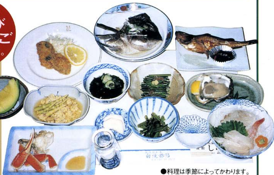
●料理は季節によってかわります。