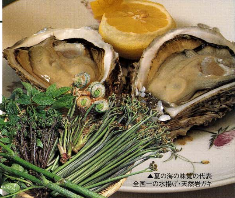
▲夏の海の味覚の代表 全国一の水揚げ・天然岩ガキ

お泊まり、会合、宴会の場として ご利用下さい。季節の山菜、 新鮮な魚、あたたかいおもてなしで お待ちしております。