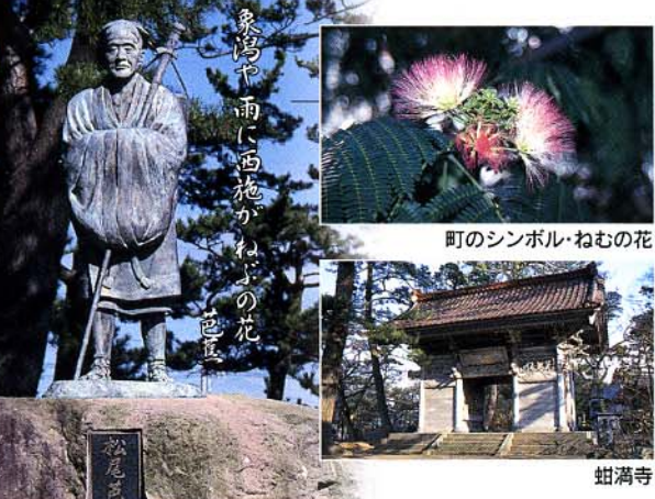
町のシンボル・ねむの花