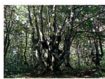
獅子ヶ鼻湿原の原生林