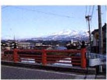
遊歩の芭蕉通りと鳥海山