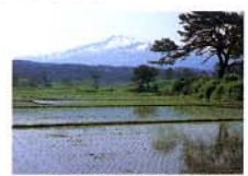
芭蕉が観た象潟と黒松