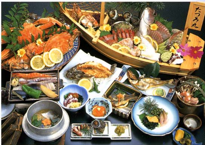
当ホテルでは、地元で獲れないマグロやハマチ、養殖タイ等は、お出し致しません。