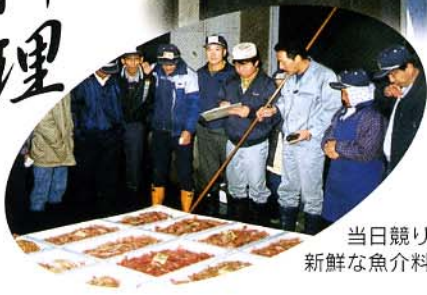
当日競り落とした新鮮な魚介料理が自慢。